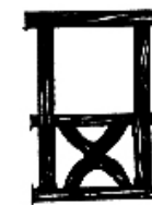
B : chaise curule