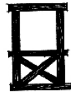
A : croix de Saint André