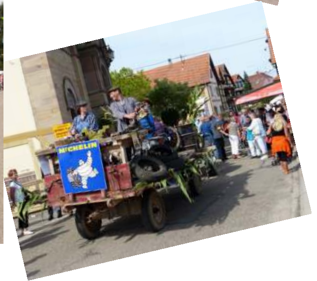
Exposition des arboriculteurs