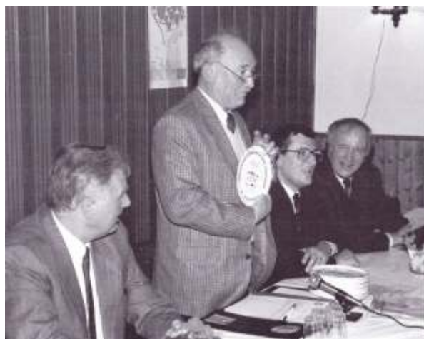
15 e Anniversaire

- Vendredi le 21 novembre 2014 (collation soupe aux pois)