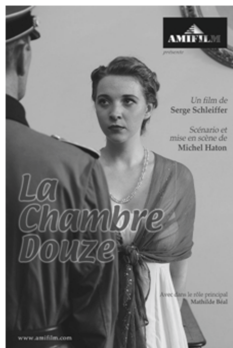
Affiche du dernier film réalisé, et projeté le 26 octobre dernier à Hindisheim.