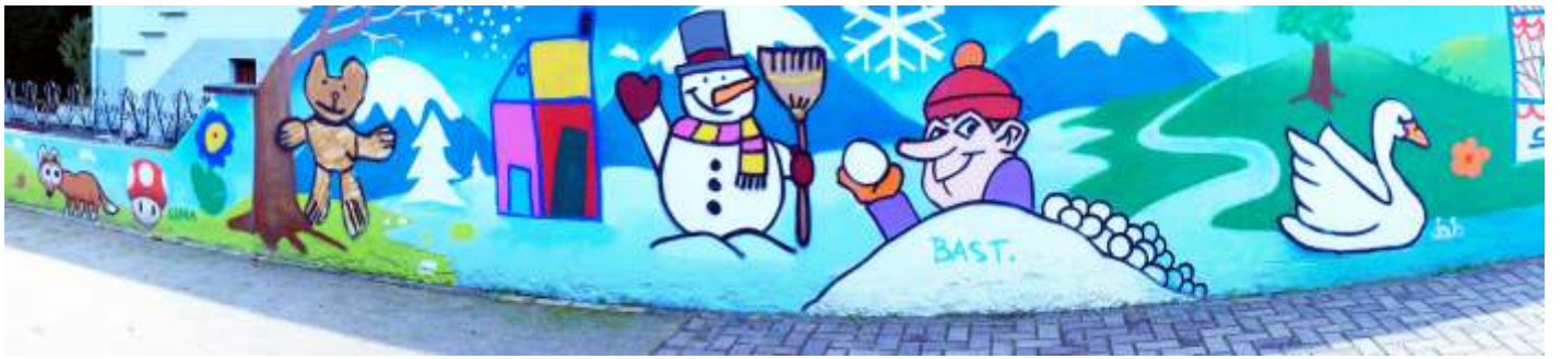
Fresque de l'école maternelle