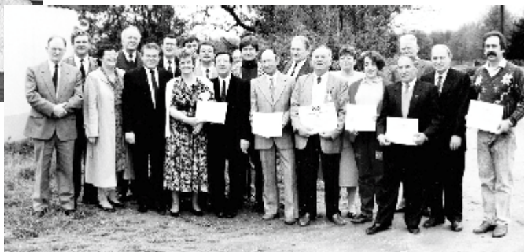
15 e Anniversaire