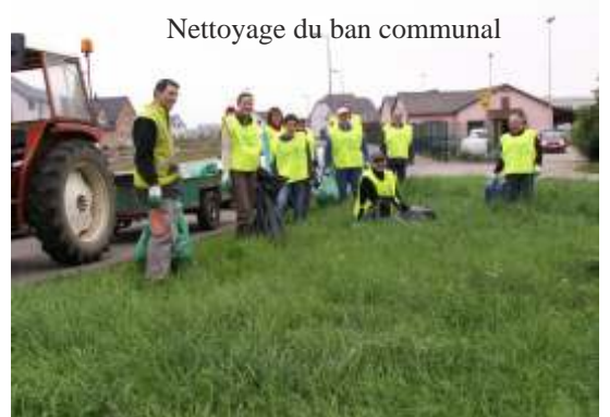
Nettoyage du ban communal